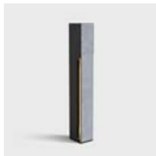
(Belgische) blauwe natuursteen