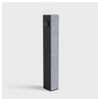
(Belgische) blauwe natuursteen