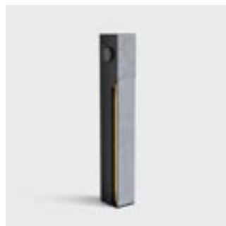
(Belgische) blauwe natuursteen